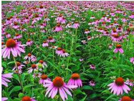
그림 1. 에키나시아 꽃

바이러스에 감염된 세포는 표면에 세균과 결합할 수 있는 수용체를 만들어 내는데 에키나시아의 유효 추출물이 그 작용을 방해하여 항바이러스 효과 및 항균 효과를 나타낸다. 또한, 염증유발인자를 감소시키고 항염증인자를 증가시켜 항염증 효과도 나타낸다.